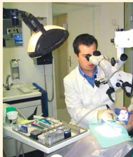
Präzision in der Wurzelbehandlung

Die hoch entwickelten Schutzmaßnahmen in den Zahnarztpraxen garantieren die niedrige Strahlenbelastung der Patienten. Zum Vergleich: Bei einem Überseeflug setzt man sich einer viermal höheren Strahlung aus als bei einer oralen Röntgenaufnahme. Das Beispiel der Wurzelbehandlung zeigt, wie wichtig die Röntgentechnik für eine vollständige Genesung ist – für die Diagnose ebenso wie während der Behandlung und anschließend zur Kontrolle des Behandlungserfolgs.