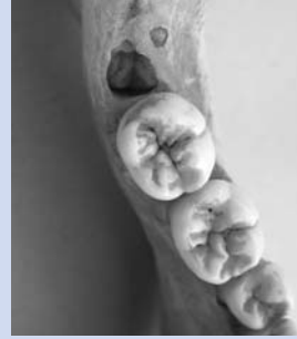
Abb. 3: Weisheitszahn des Unterkiefers im Zahnbett hinter dem zweiten Backenzahn.

Die Empfehlung zu einer Weisheitszahnentfernung ist immer eine individuelle Entscheidung, die Ihr(e)